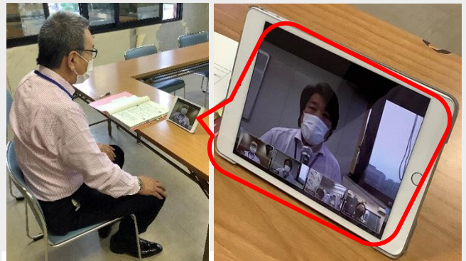
【給食会からの連絡】