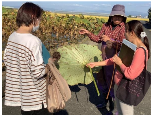
【撮影後、レンコンの学習】