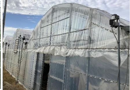
【ビニルハウスの圃場】