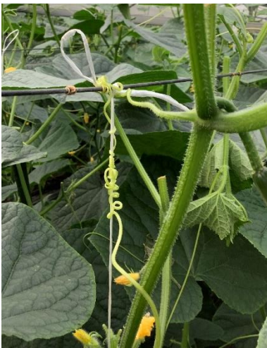
【茎にひもを絡めて上で結ぶ】